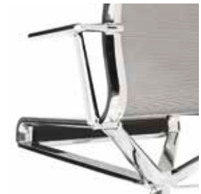
Breathable elastic mesh