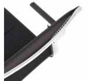
Die-cast aluminium handle